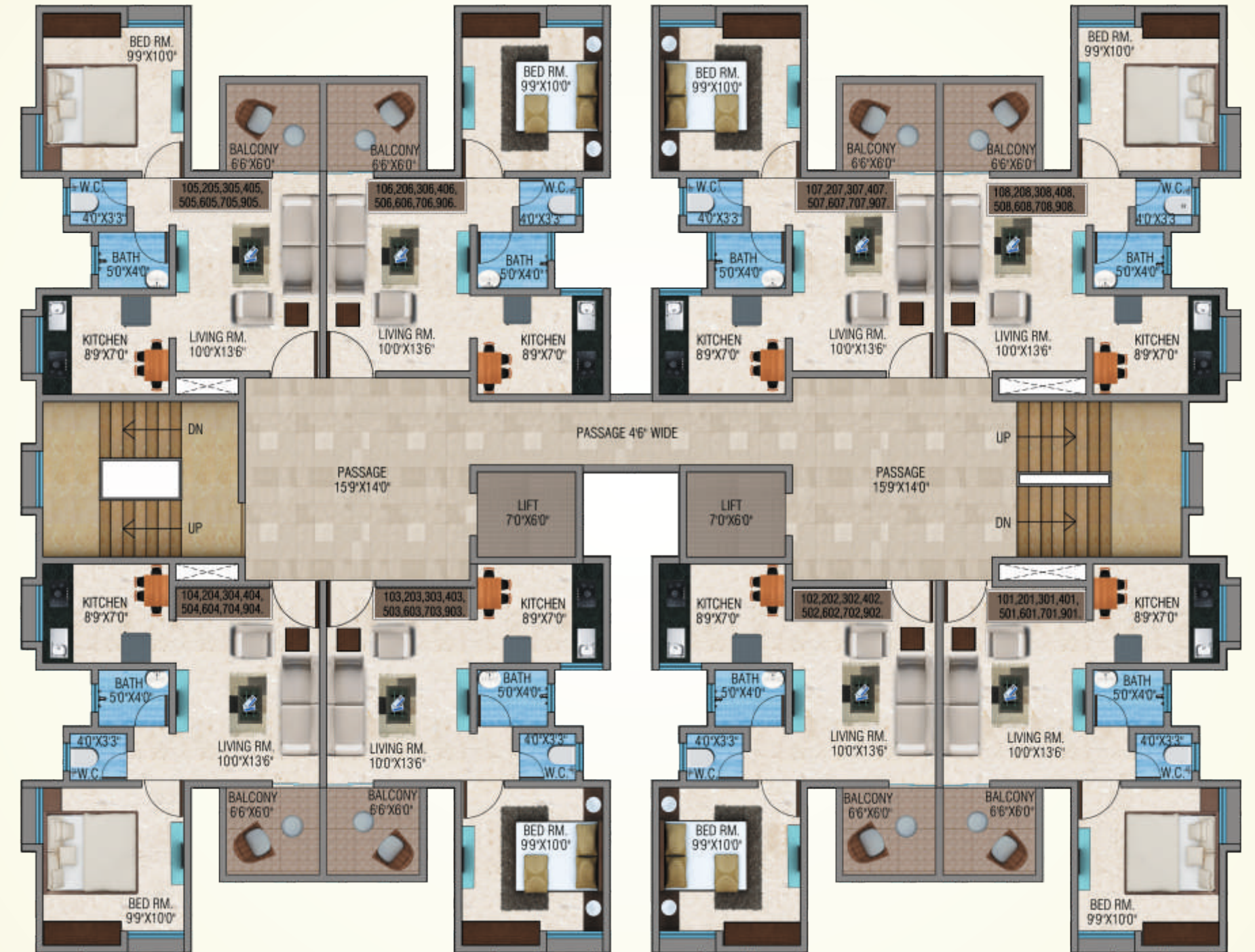
1ST, 2ND, 3RD, 4TH, 5TH, 6TH, 7TH, 8TH & 9TH FLOOR PLAN