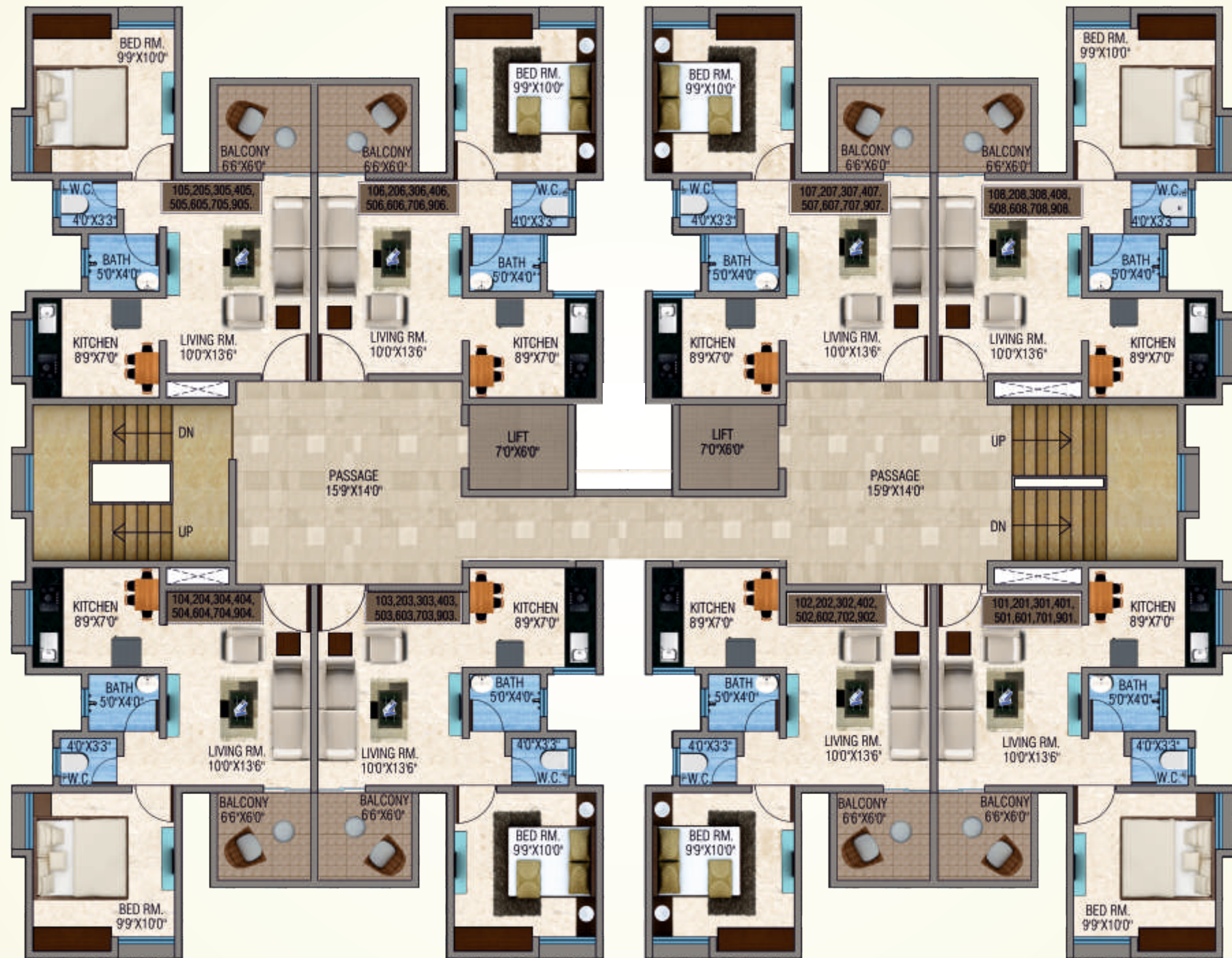
1ST, 2ND, 3RD, 4TH, 5TH, 6TH, 7TH, 8TH & 9TH FLOOR PLAN