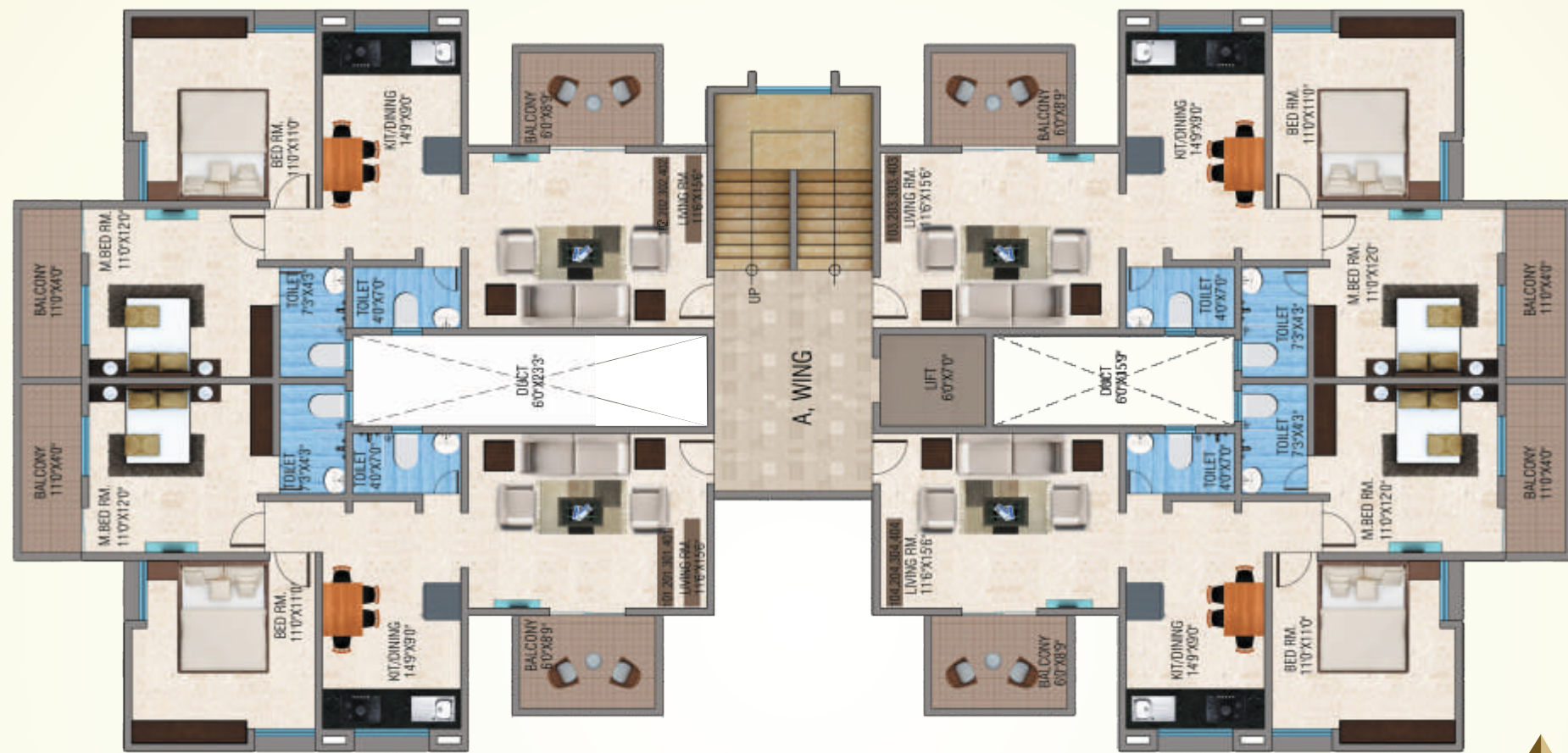
1ST, 2ND, 3RD & 4TH FLOOR PLAN